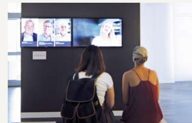
Интервью с историками литературы, театральными режиссёрами и драматургами об актуальности Чехова в наши дни.