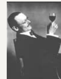
Герман Гессе. 1910 г.

вания в области североамериканской литературы и культуры. Страницы литературного музея посвящены и первому премьер-министру Индии Джавахарлалу Неру (1889-1964), дописавшему в Баденвайлере свою автобиографию. Он жил здесь вместе с находящейся на лечении супругой Камалой в 1935-1936 гг.