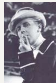
Аннетта Кольб. Немецкая писательница и подданная двух отечеств – Германии и Франции. Прибл. 1910 г.