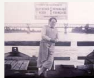
Рене Шиккеле на мосту через Рейн вблизи Нойенбурга. Разделительная вывеска немецко-французской границы проходит прямо через его сердце. Конец 1920-х годов.