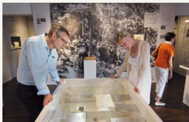
Взгляд на выставку. Музейная витрина, посвященная творчеству А.П. Чехова.