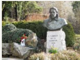
Памятник А.П. Чехову и российской эпохе «перестройки», установлен на месте первого памятника писателю в Баденвайлере открыт в 1992 г. Дар дальневосточного острова Сахалин, 1990 г.

Материалы, посвященные жизни и творчеству Антона Чехова (1860-1904), составляют основу экспозиции музея. Она рассказывает о жизни писателя в России и смерти его в Баденвайлере. Биографическая летопись и экспонаты предлагают небольшой экскурс в историю, политику и искусство того времени, начиная с 1860 года. Еще одной важной темой выставки является культура памяти А.П. Чехова в Баденвайлере и ее значение для поддержания российскогерманского культурного диалога.