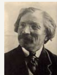
Шолом Алейхем, написавший в Баденвайлере рассказы и роман «Блуждающие звезды».