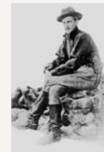
Военный корреспондент Стивен Крейн. Греция, 1897 г.