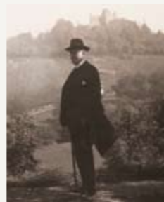
Константин Станиславский. Баденвайлер, 1929 г.

Шолом Алейхем – русско-еврейский писатель, важнейший представитель литературы на идише, считавшимся языком простого народа вплоть до времен Холокоста. Многочисленные произведения он написал во время его пребывания в Баденвайлере в 1910-1911 гг. Его роман «Тевье, молочник» послужил сюжетом для мюзикла «Анатевка».